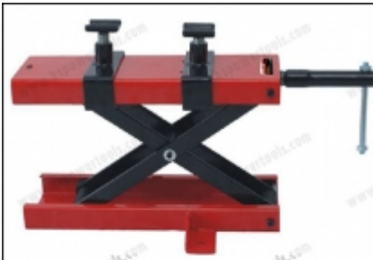
ลิฟต์ยกของไฮดรอลิก แบบประตอขึ้น MINI LIFT