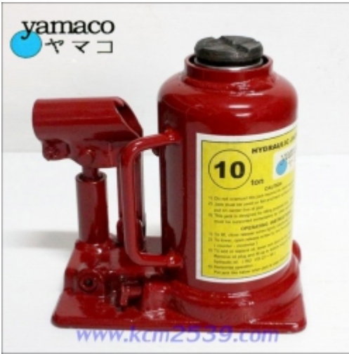
à¹•à¸,jà¹•à¹•à¸,£à¸,†à¸,•à¸,£à¸,°à¸,à¸,à¸,• 10à¸,•à¸,±à¸,™ yamaco Call for Pricing