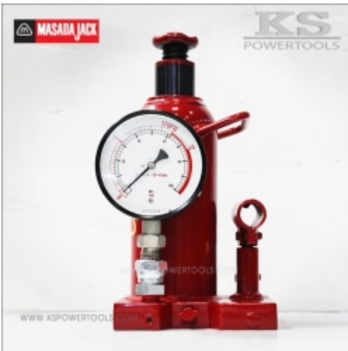
à¹•à¸,jà¹•à¹•à¸,£à¸,†à¸,•à¸,£à¸,°à¸,à¸,à¸,• à¸,à¸,à¸,"à¹•à¸,•à¸,^ MASADA Call for Pricing

à¹•à¸,jà¹•à¹•à¸,£à¸,†à¸,•à¸,à¸,"à¹•à¸,•à¸,^ [Product Details...]